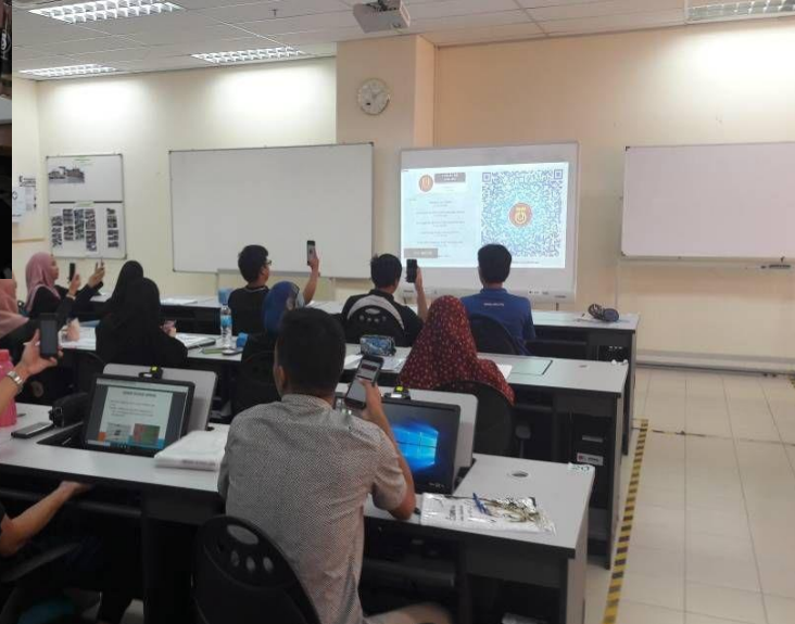
CONTOH QR CODE